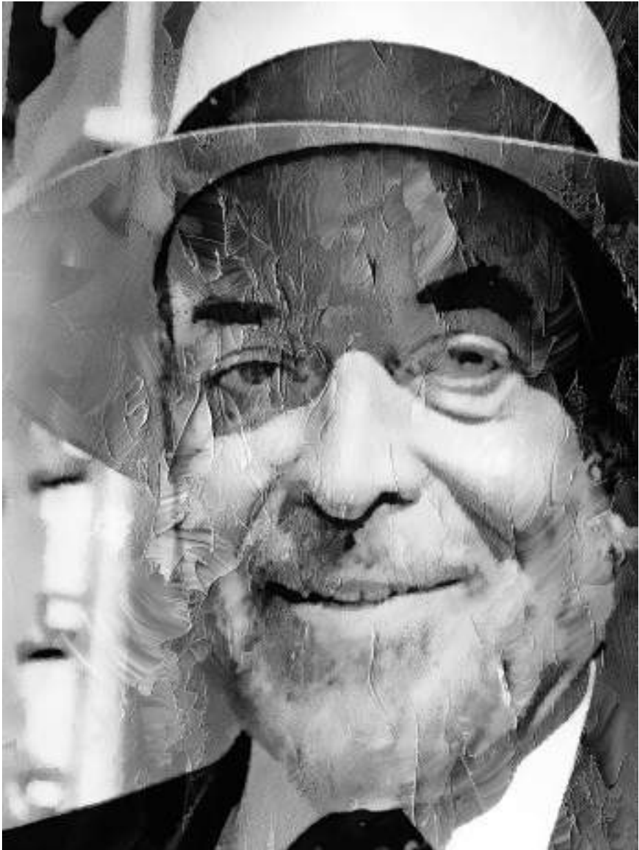
RUBÉN BAREIRO SAGUIER